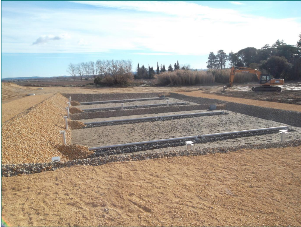
La station d'épuration pas à pas

La réalisation de la station d'épuration écologique : le gros investissement du Mandat municipal