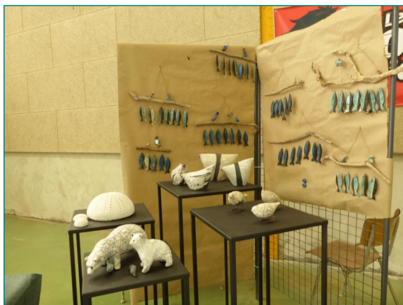
Au fil du Canal...Roubia