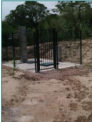
Ne manque que le raccordement électrique pour mettre la station en service