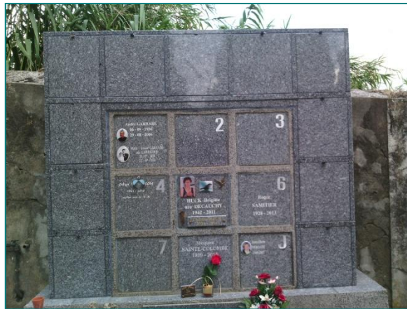
L'agrandissement du colombarium