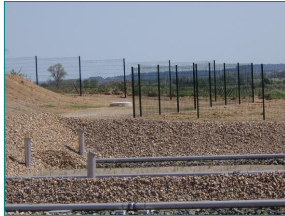
La plantation des roseaux