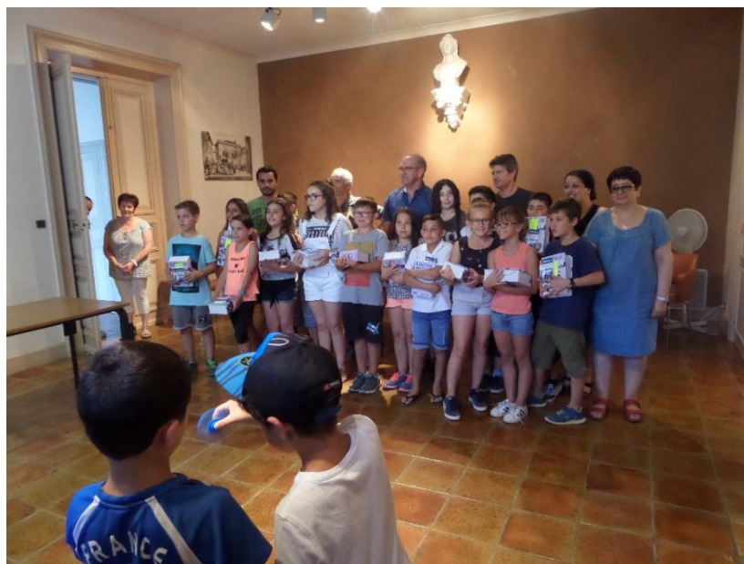
La fête de la musique organisée par les associations de Roubia

La cérémonie de remise des dictionnaires pour les futurs collégiens du regroupement scolaire Roubia/Argens/Paraza en mairie de Roubia le 19 juin