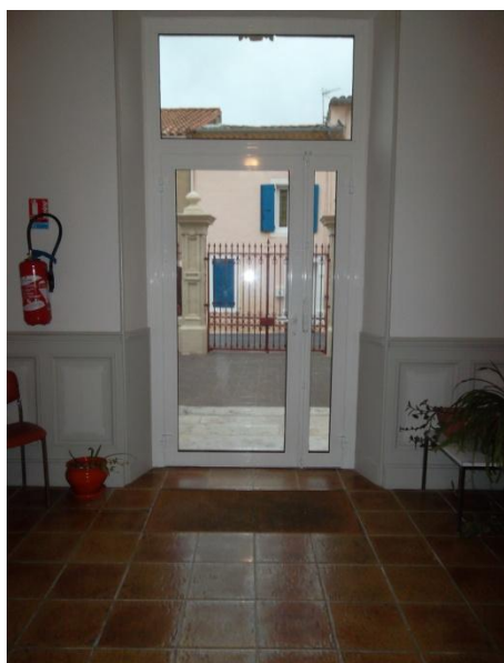
Changement de la porte de la Mairie