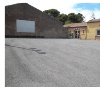
Le parking de la cour des Associations