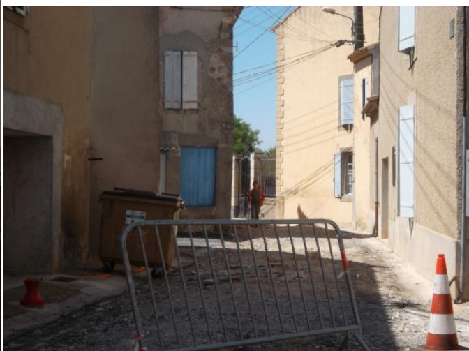
Réfection de la chaussée rue des Vignerons et des Fossés