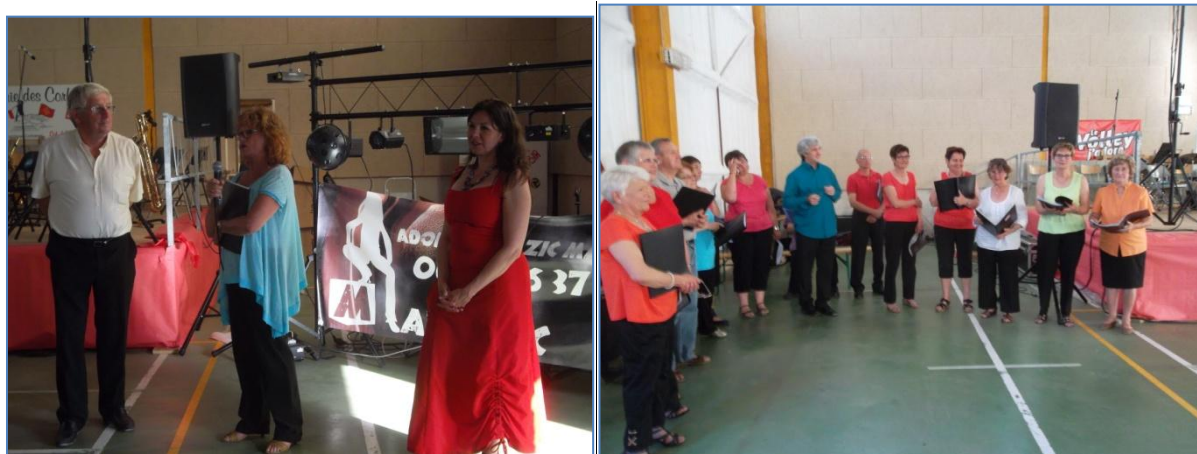
La chorale le Triolet et l'Harmonie d'Ouveillan à l'honneur lors de la fête de la Musique

La fête de la musique est organisée par les associations du village avec le concours de la Municipalité